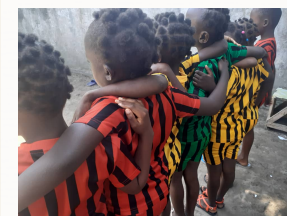
La team des filles

Envoyez un email à orphelinat@reseaufce.org pour en savoir plus et changer la vie d'un enfant.