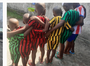
La team des garçons