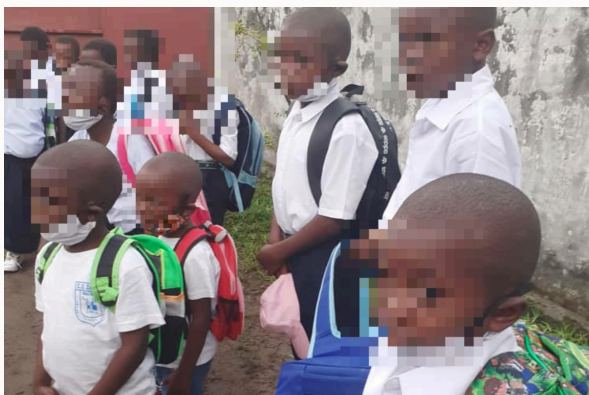
En route pour l'école - Kinshasa - Septembre 2020

L'orphelinat Nid d'Espoir été fondé à Kinshasa en République Démocratique du Congo en juin 2020 par l'Association Réseau Femme Citoyenne Engagée. Révoltés par la situation des enfants orphelins dans le territoire de Béni toujours en proie à des violences des groupes armés, les membres de l'Association décident de venir en aide à ces enfants pleins de potentiel mais dont le décès tragique par arme d'au moins un des parents peut ternir l'avenir. Alors que l'Association envisageait d'installer la structure en territoire de Béni, la recrudescence des violences dans les villages et écoles du territoire a finalement pousser l'Association à rechercher un terrain plus propice à la sécurité et au développement des enfants. C'est ainsi que les 11 premiers enfants arrivèrent à Kinshasa en Septembre 2020 pour y être accueillis au sein de Nid d'Espoir.