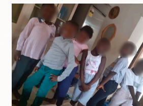
Défilé avec les vêtements reçus en don - Mars 2021

Si vous êtes à Kinshasa, vous pouvez prendre rendez vous et déposer vos dons directement à l'Orphelinat, à Kinkole. Pour les personnes résidant à l'étranger (Belgique), nous organisons régulièrement des collectes via notre partenaire belge et que nous envoyons à Kinshasa. Pour plus d'informations, merci de suivre nos actualités sur le site web